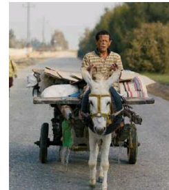
'My name is Sara' di S. Orritt (concorso 6-15) e 'Yomeddine' di A.B. Shawky (16-20)