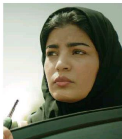
Alle 20.45 all'Espocentro

È uno sguardo a 360 gradi, quello di Haifa Al Mansour, su un mondo dove non solo le donne riescono, seppure a fatica, a conquistare un proprio spazio, ma anche le arti e la musica trovano nuova vita: il ritratto di una rivoluzione graduale, forse non silenziosa ma neppure urlata, il che forse spiega una certa timidezza nel racconto di Haifa Al Mansour, attenta a evitare eccessi enfatici. C'è un'incredibile educazione e rispetto nella regia e nell'interpretazione di un gruppo di attrici e attori di gran volontà.