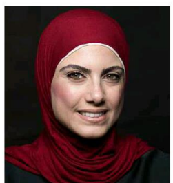
Alle 20.45 all'Espocentro